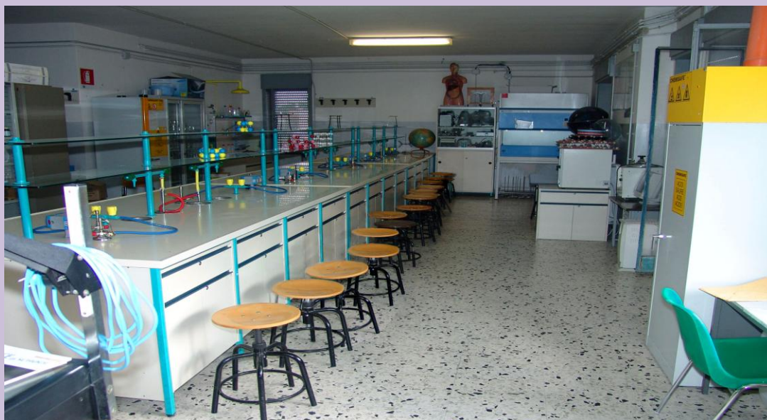
laboratorio di scienze