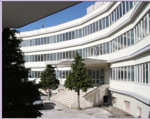
Succursale di Via Antiniana

Il Liceo Scientifico “Arturo Labriola”, situato nel quartiere di Bagnoli (Distretto n°40), con succursale in via Antiniana, è stato istituito nel 1971; pertanto, forte dei suoi quarant’anni, ma nel contempo relativamente giovane , riesce a coniugare tradizione ed innovazione, risultando ben radicato nel contesto territoriale.